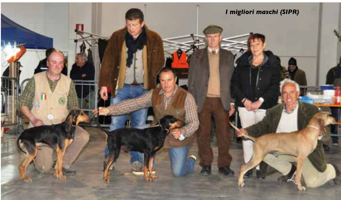
I migliori maschi (SIPR)