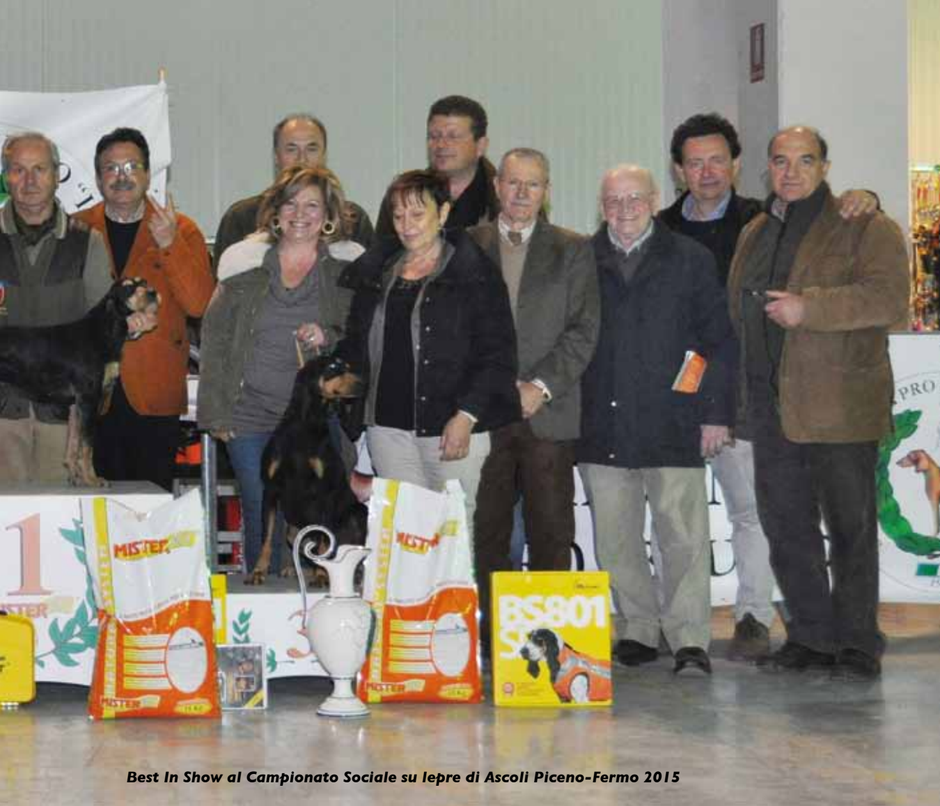
Best In Show al Campionato Sociale su lepre di Ascoli Piceno-Fermo 2015