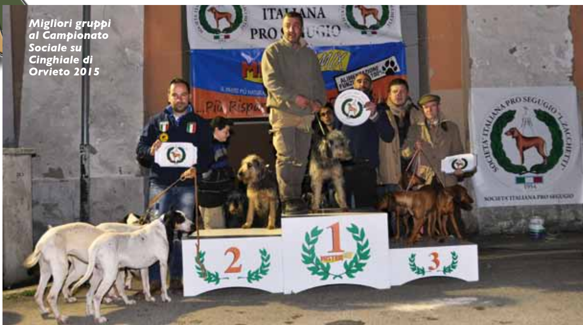
Migliori gruppi al Campionato Sociale su Cinghiale di Orvieto 2015