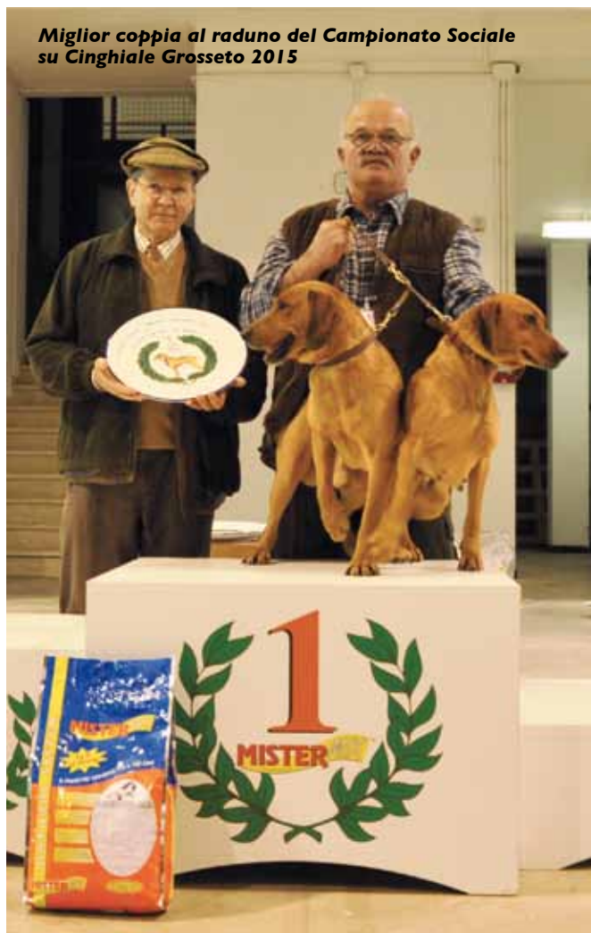
Miglior coppia al raduno del Campionato Sociale su Cinghiale Grosseto 2015