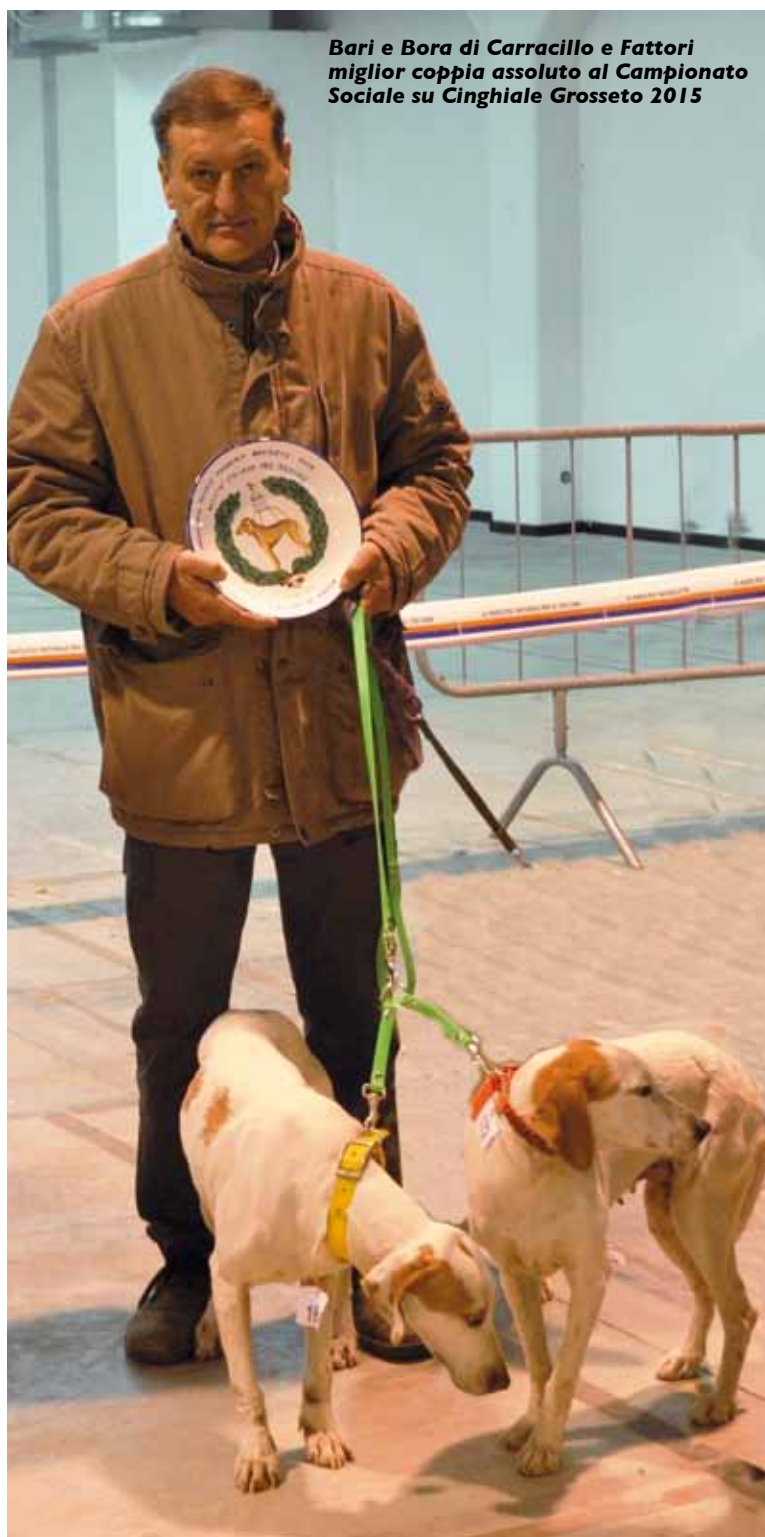
Bari e Bora di Carracillo e Fattori miglior coppia assoluta al Campionato Sociale su Cinghiale Grosseto 2015

Il Raduno s'è svolto comunque al coperto, per evitare ogni rischio, i Segugi hanno sfilato sotto gli occhi esigenti dei giudici e degli appassionati presenti. Tutto è filato come al solito alla perfezione, anche nel 2015 la festa della SIPS nazionale si svolta nel migliore dei modi possibili.