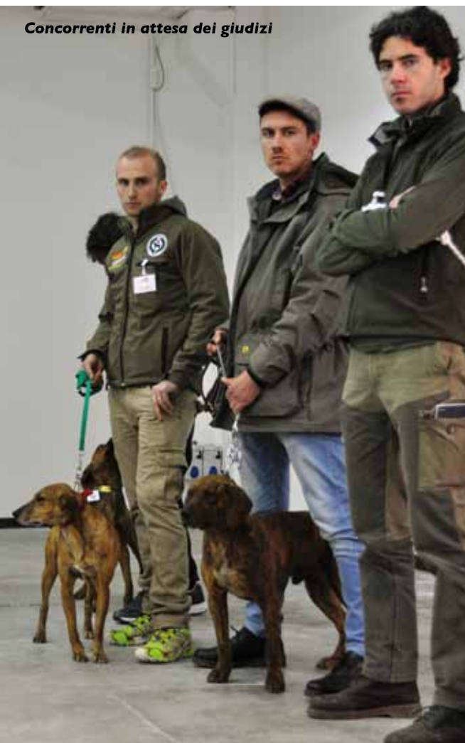
Concorrenti in attesa dei giudizi