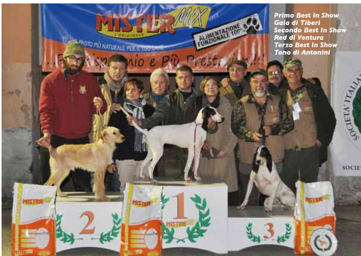
Primo Best In Show Gaia di Tiberi Secondo Best In Show Red di Ventura Terzo Best In Show Tono di Antonini

Oltre questi risultati completi, tante qualifiche individuali. Al prossimo anno di nuovo ad Orvieto.