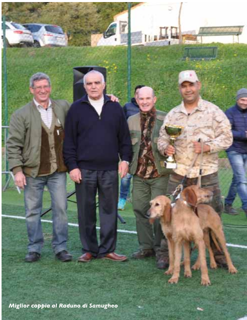
Miglior coppia al Raduno di Samugheo