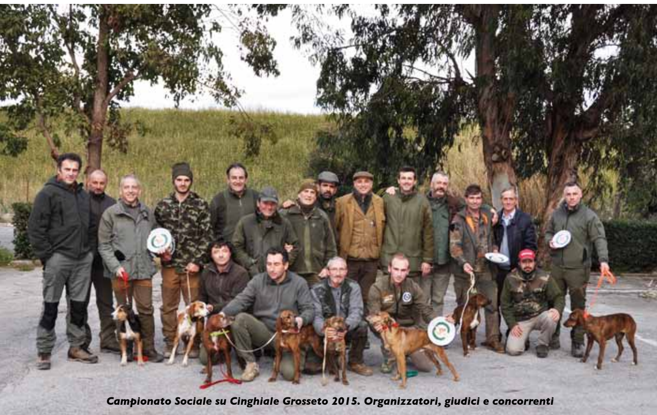
Campionato Sociale su Cinghiale Grosseto 2015. Organizzatori, giudici e concorrenti