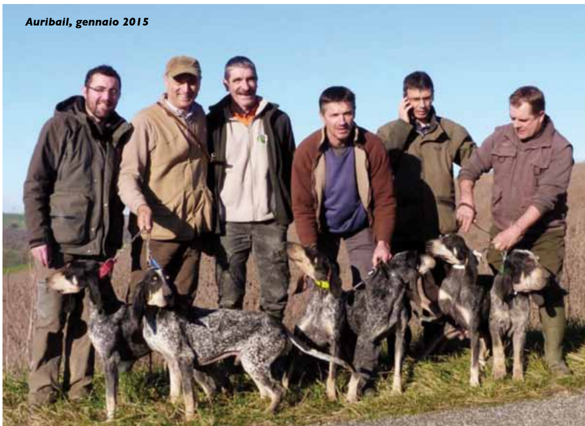
Auribail, gennaio 2015

Ma molti di noi non hanno collaborato in questa fase impegnativa della SIPS: ci sono tanti organizzatori che si accorgono della man-