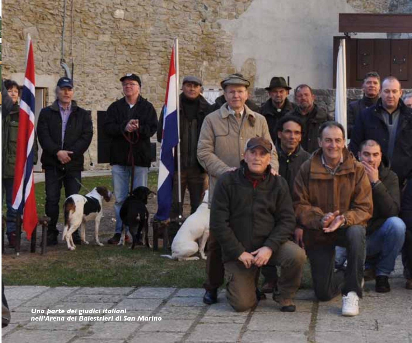
Una parte dei giudici italiani nell'Arena dei Balestrieri di San Marino