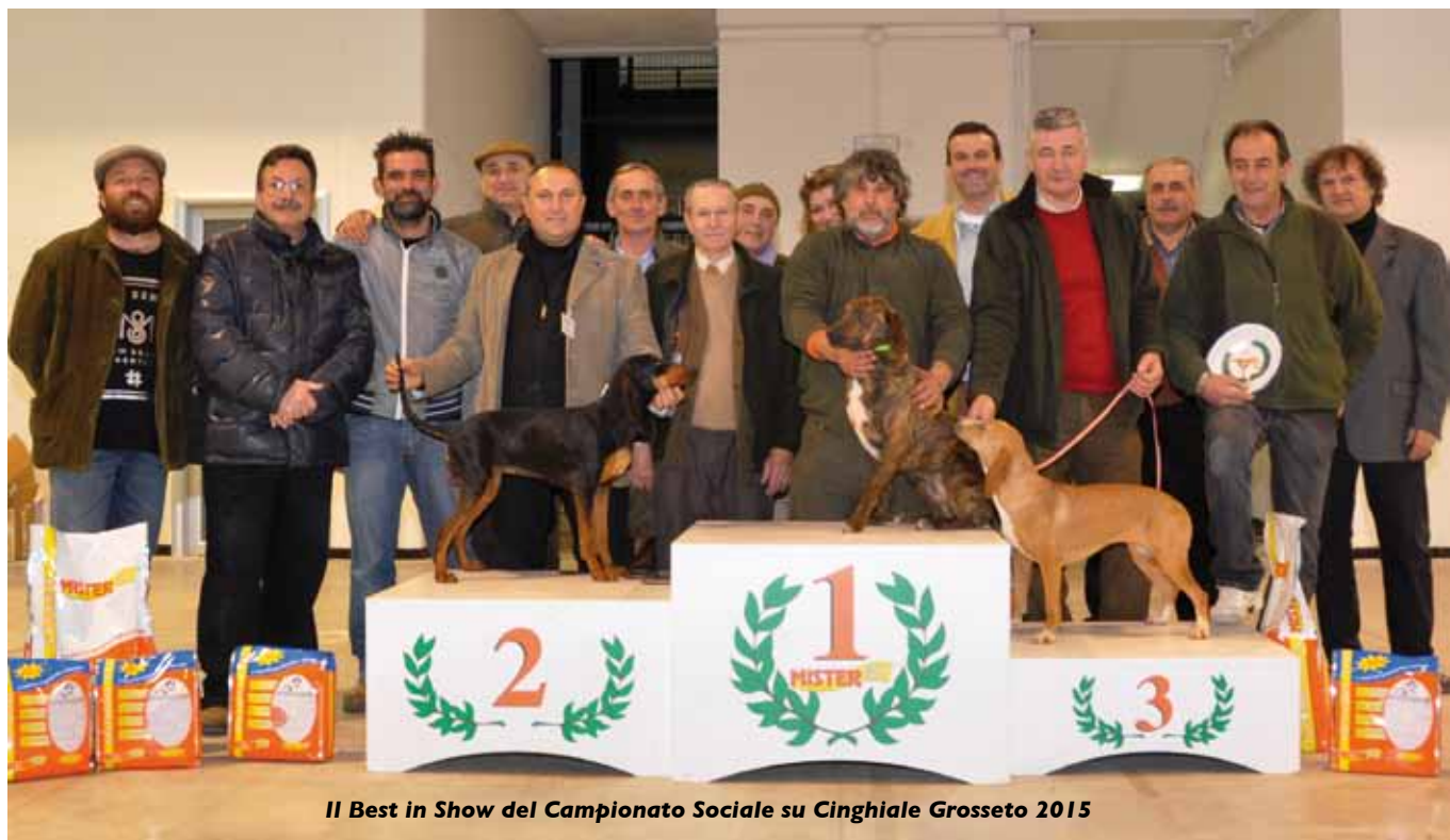
Il Best in Show del Campionato Sociale su Cinghiale Grosseto 2015