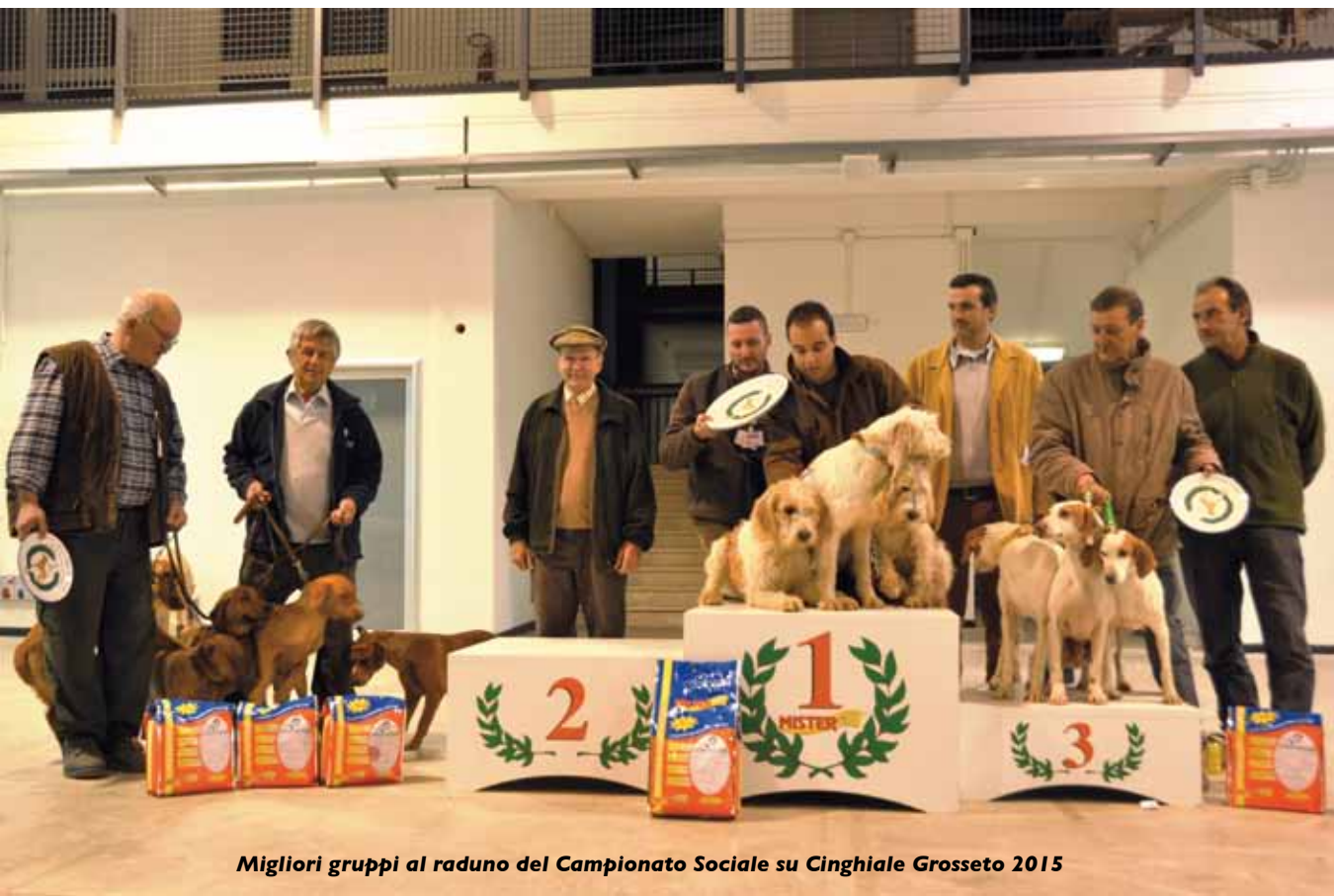
Migliori gruppi al raduno del Campionato Sociale su Cinghiale Grosseto 2015