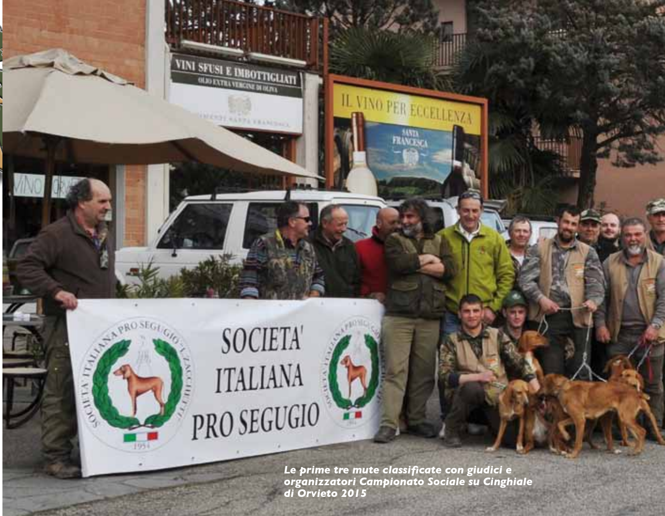
Le prime tre mute classificate con giudici e organizzatori Campionato Sociale su Cinghiale di Orvieto 2015