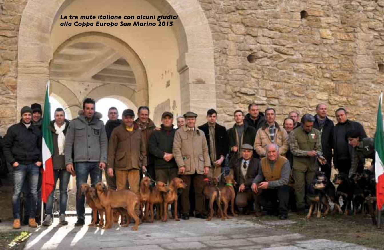
Le tre mute italiane con alcuni giudici alla Coppa Europa San Marino 2015