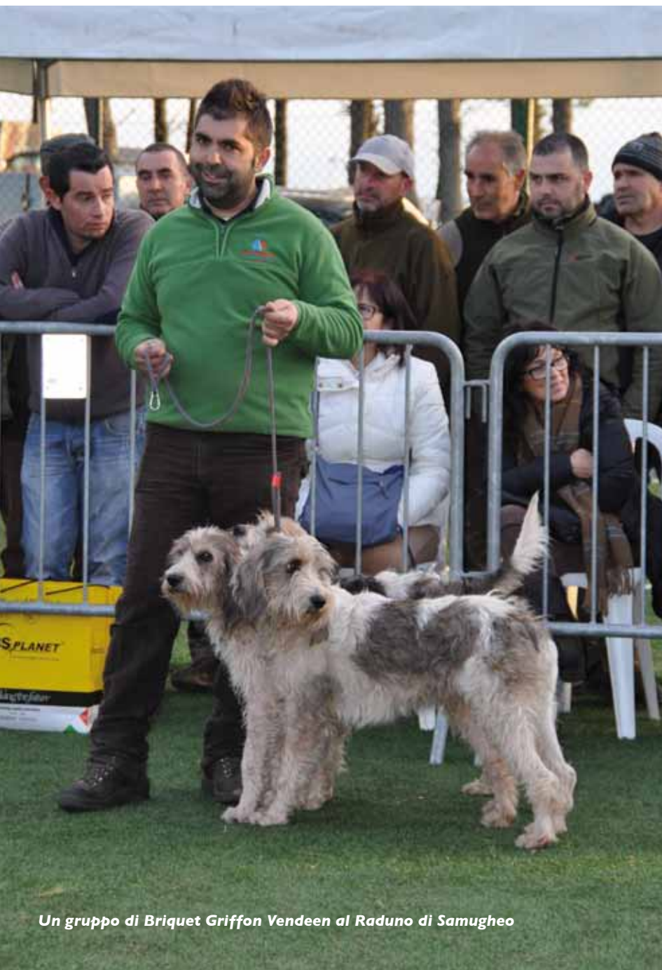
Un gruppo di Briquet Griffon Vendéen al Raduno di Samugheo

Il luogo del Raduno era situato in una folta pineta che ha fatto da cornice e da ombra per tutti i cani legati al fresco sotto gli alberi, con un cielo, che prima plumbeo, poi sempre più sereno.