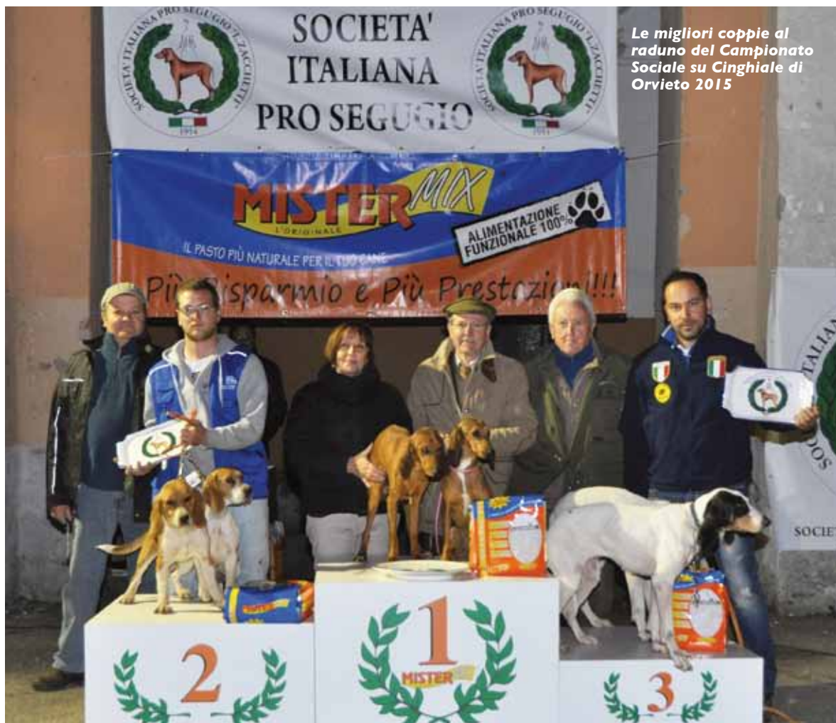
Le migliori coppie al raduno del Campionato Sociale su Cinghiale di Orvieto 2015