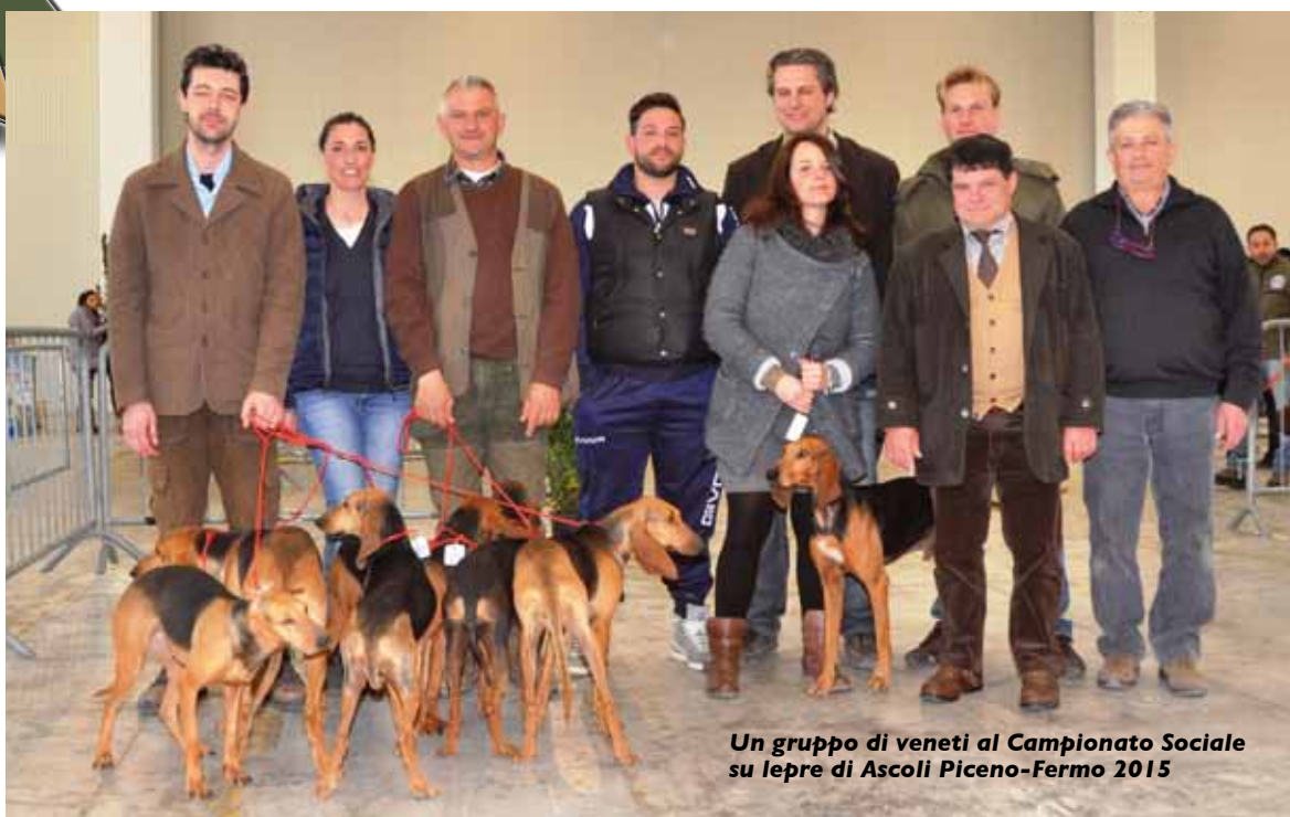
Un gruppo di veneti al Campionato Sociale su lepre di Ascoli Piceno-Fermo 2015