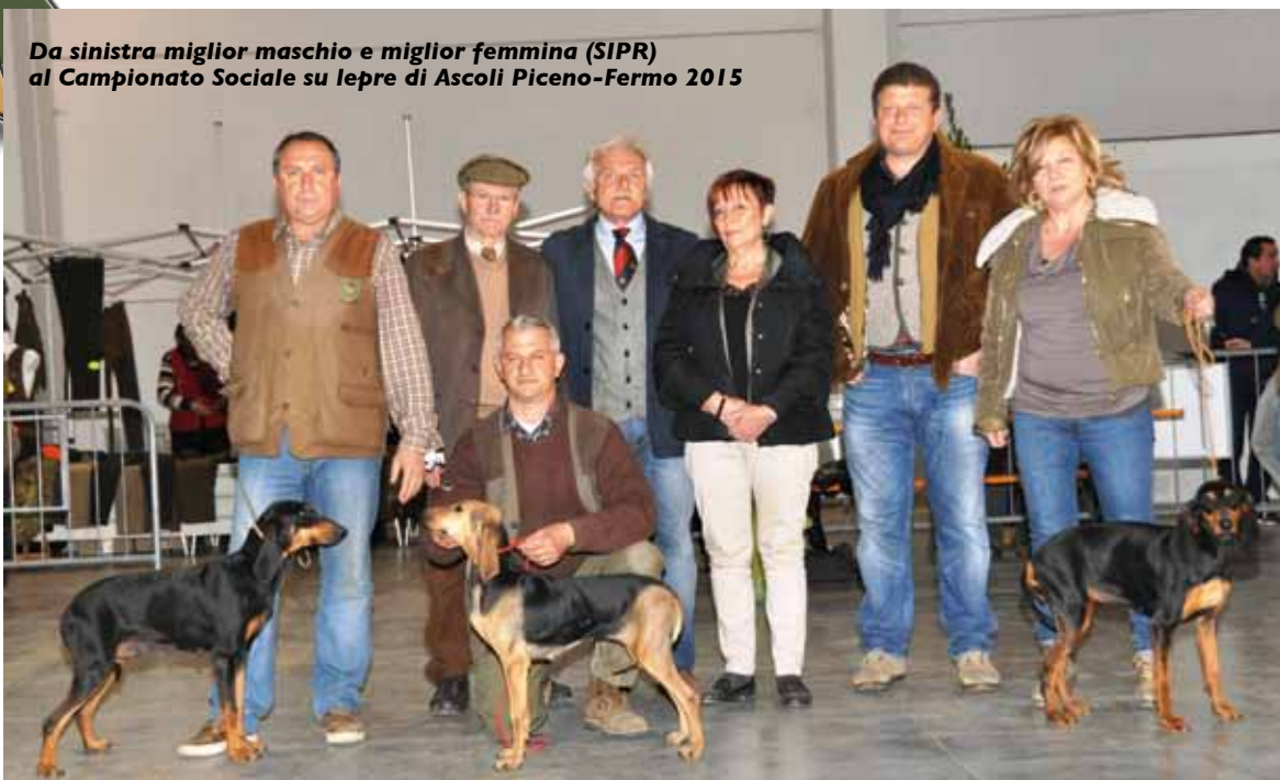
Da sinistra miglior maschio e miglior femmina (SIPR) al Campionato Sociale su lepre di Ascoli Piceno-Fermo 2015