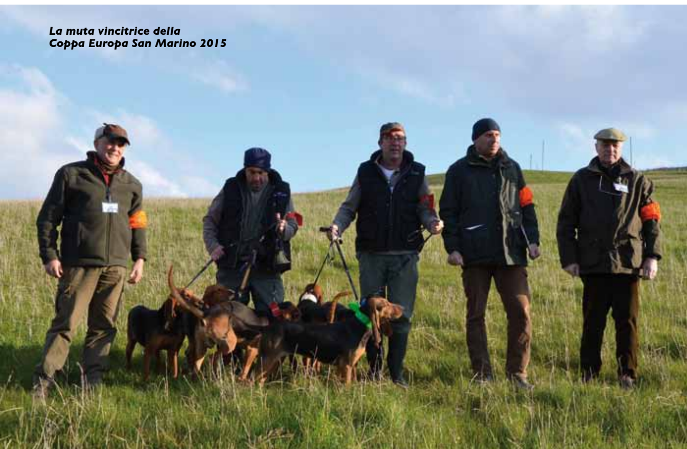
La muta vincitrice della Coppa Europa San Marino 2015

di Pompiano, Gin; Segugi Italiani a pelo forte nero focati di Calisto Ferrero. 2) Rino, Zac, Birba, Deva, Mery, Lula, Iona; Segugi Italiani a pelo raso fulvo di Carlo Generotti. 3) Mark, laribi di Appignano, Bricca, luma di Appignano, luche di Appignano, Kora, Kimba, Indio di Appignano; Segugi Italiani a pelo raso fulvi di Andrea Cataldi.