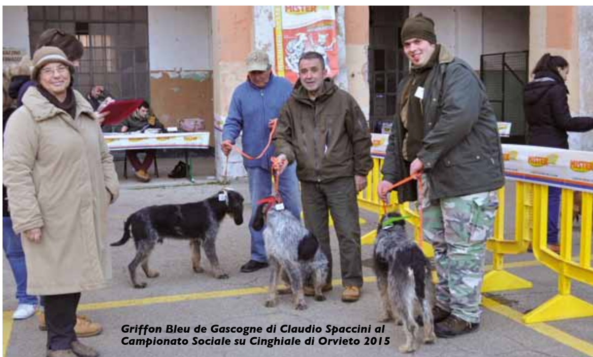
Griffon Bleu de Gascogne di Claudio Spaccini al Campionato Sociale su Cinghiale di Orvieto 2015