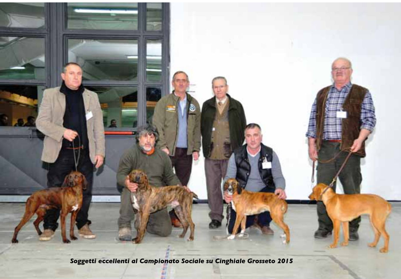
Soggetti eccellenti al Campionato Sociale su Cinghiale Grosseto 2015

aziende faunistico venatorie che ci hanno concesso la magnifica arena nella quale si è svolto il Campionato Sociale SIPS su Cinghiale per le categorie singolo e coppie.