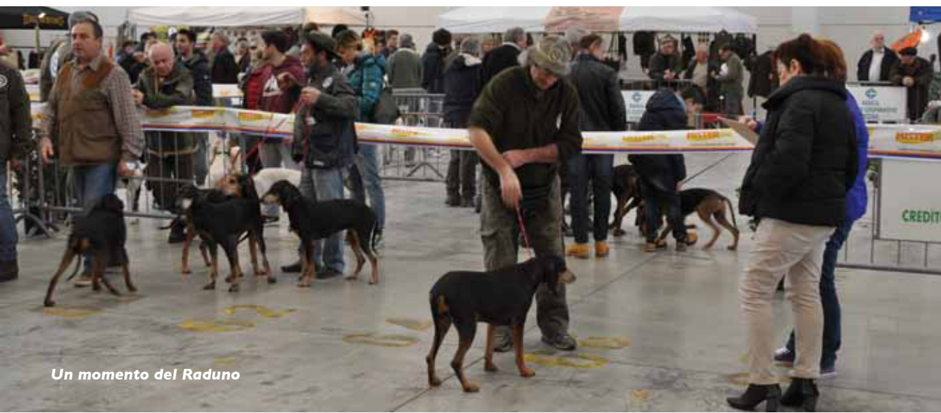
Un momento del Raduno