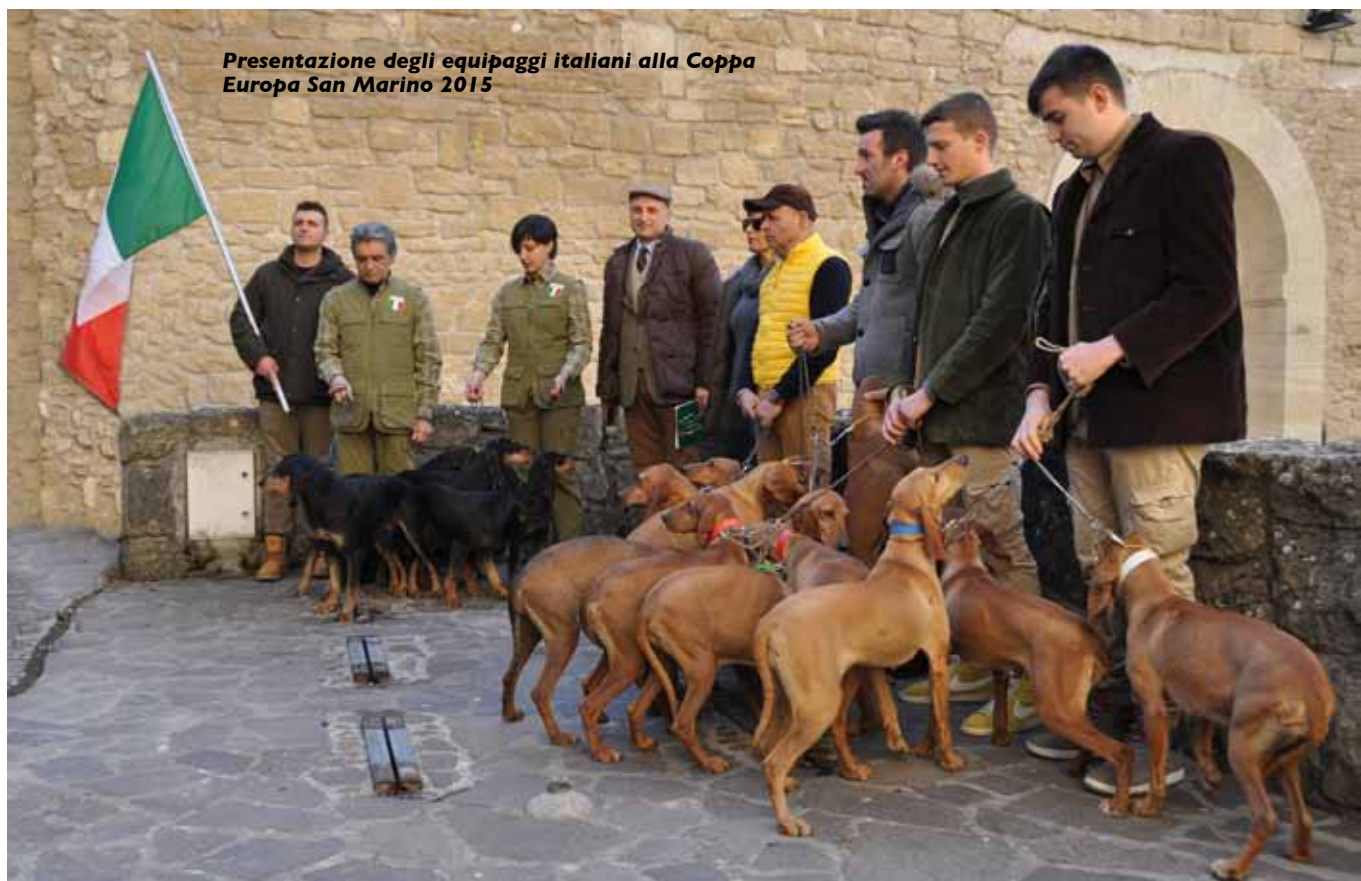
Presentazione degli equipaggi italiani alla Coppa Europa San Marino 2015

Il termine di presentazione della documentazione è stato stabilito per il 15 gennaio 2015. I selezionatori dopo aver visionato i documenti inviati, hanno potuto stabilire coloro che avevano i requisiti per accedere alla selezione. Nella prova del 24 e 25 gennaio a Pesaro sono state visionate