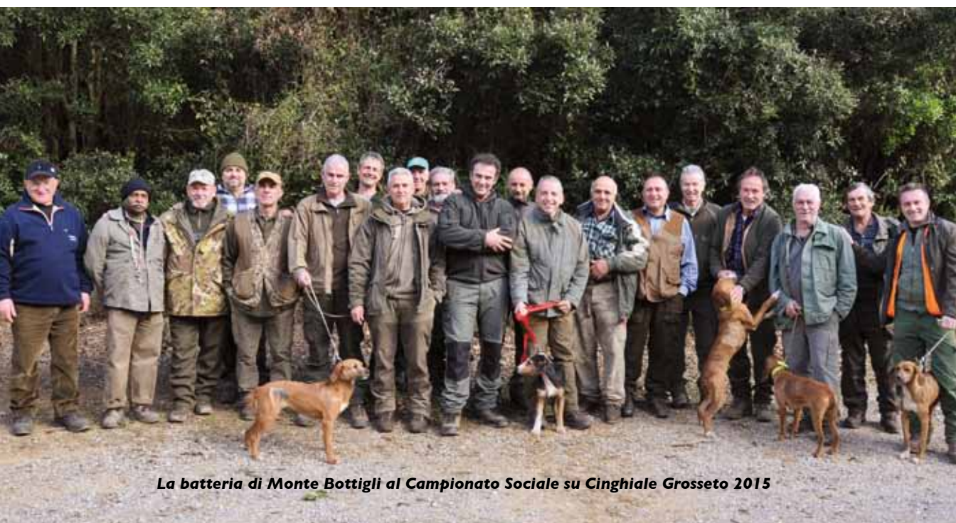
La batteria di Monte Bottigli al Campionato Sociale su Cinghiale Grosseto 2015