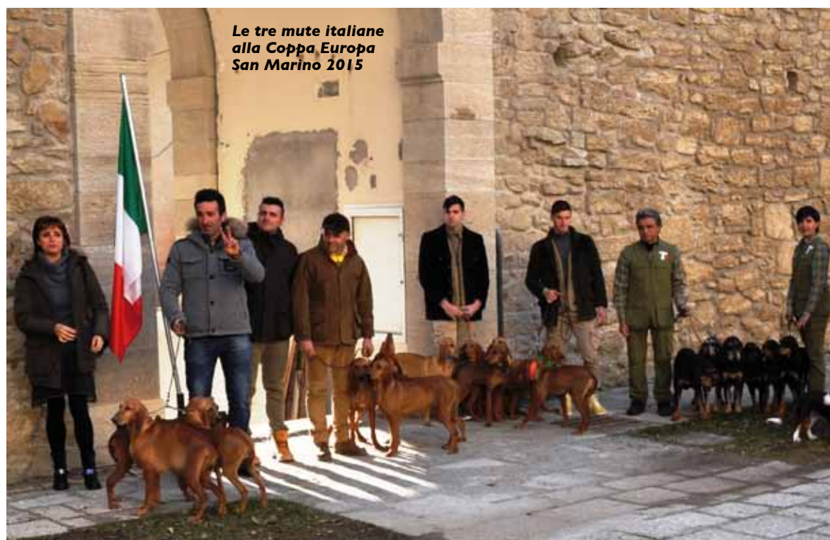
Le tre mute italiane alla Coppa Europa San Marino 2015