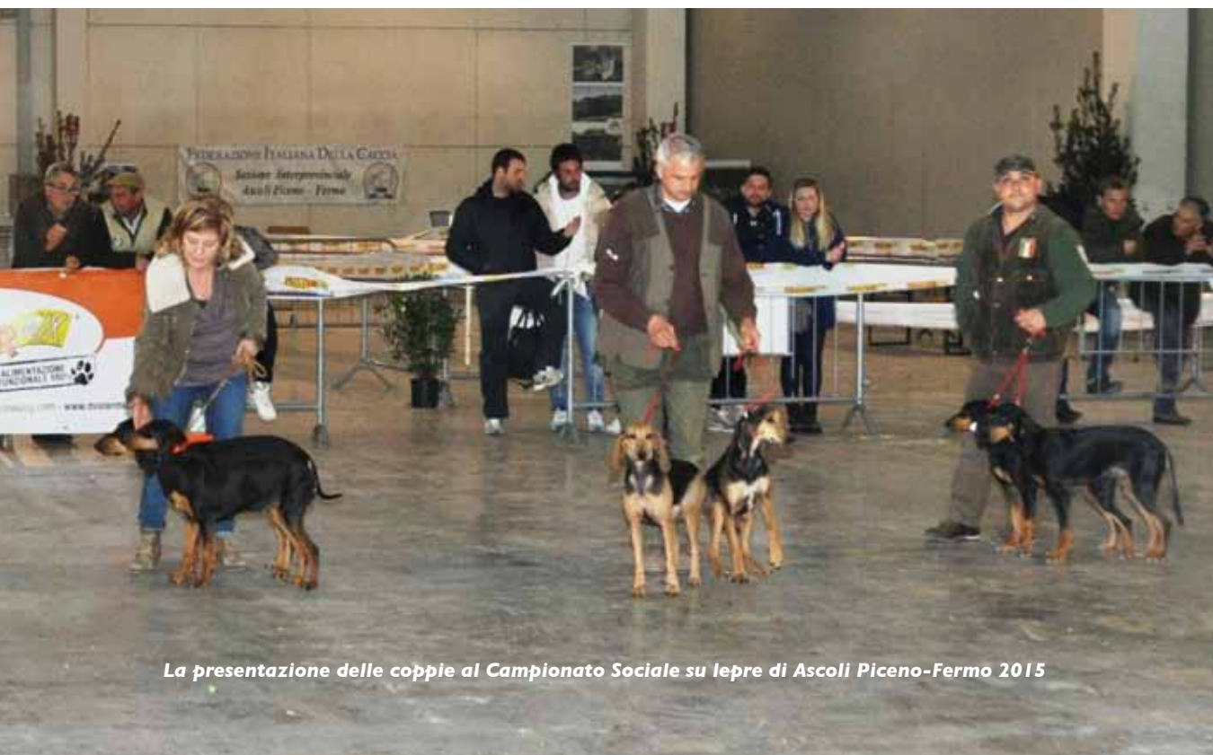
La presentazione delle coppie al Campionato Sociale su lepre di Ascoli Piceno-Fermo 2015

Il presidente della SIPS nazionale Vincenzo Ferrara ha salutato e ringraziato il Presidente dell'Enci, le autorità locali e tutti i soci presenti per aver partecipato al