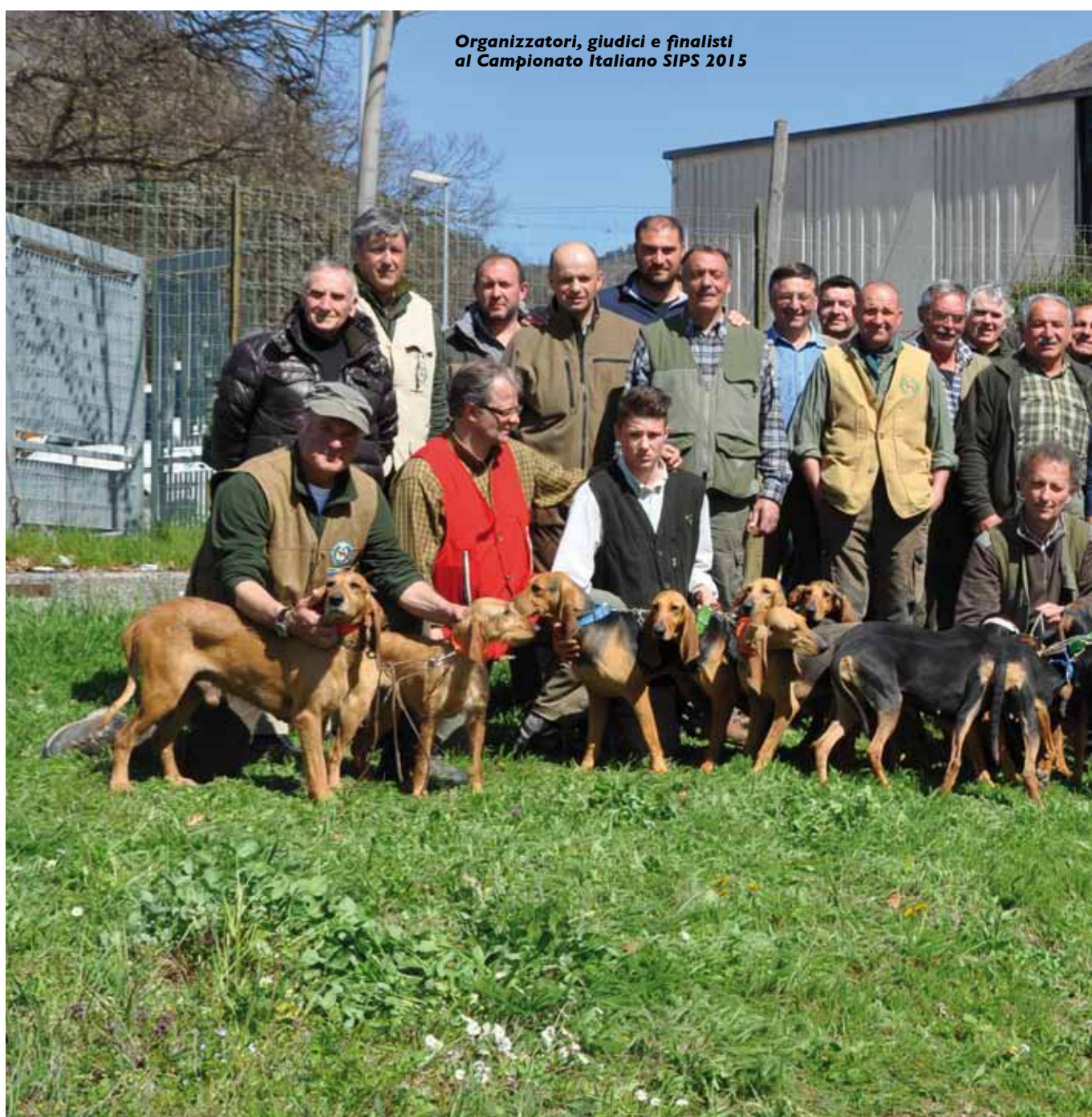
Organizzatori, giudici e finalisti al Campionato Italiano SIPS 2015

Arrivederci per il prossimo anno al Campionato Italiano della SIPS che si svolgerà in Veneto.