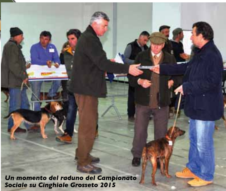
Un momento del raduno del Campionato Sociale su Cinghiale Grosseto 2015