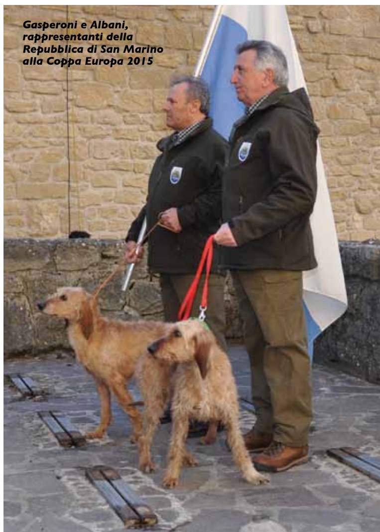
Gasperoni e Albani, rappresentanti della Repubblica di San Marino alla Coppa Europa 2015

I soggetti che hanno preso parte alla manifestazione appartengono alle seguenti razze da seguita: Basset Hound, Beagle, Crnogorski Planinski Gonic, Drever, Dunker