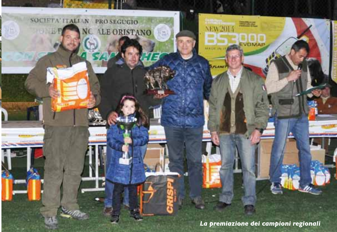
La premiazione dei campioni regionali